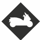
PERMIS MAXI SCOOTER